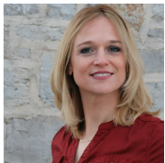
Animatrice : Valérie Martin

L'EPN de Wellin est un service de la commune de Wellin.